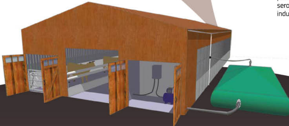
Etude 3D d'une citerne

Les textiles Serge Ferrari sont reconnus pour leur robustesse et leur entretien facile. À l'initiative du Groupe Serge Ferrari®, les matériaux composites souples polyester sont recyclés. L'objectif est de produire de nouvelles matières premières qui seront ensuite réutilisées dans des productions industrielles.