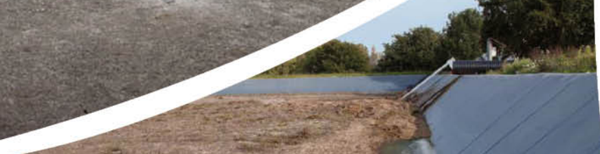
Fosse à lisier Sigournais (85)