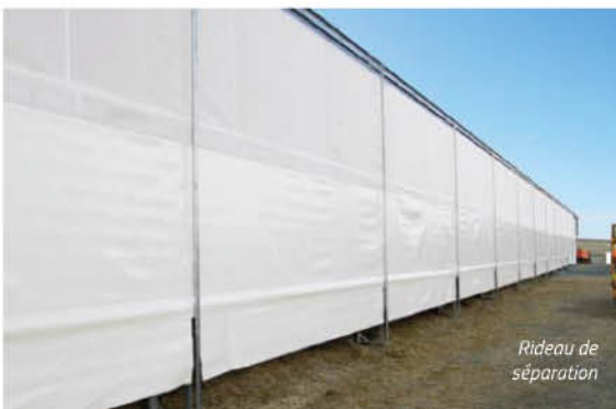
Rideau de séparation