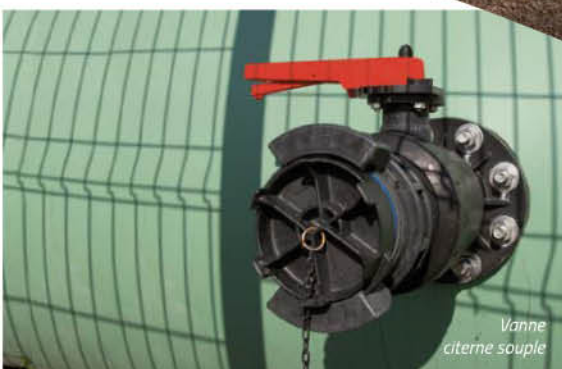
Vanne citerne souple