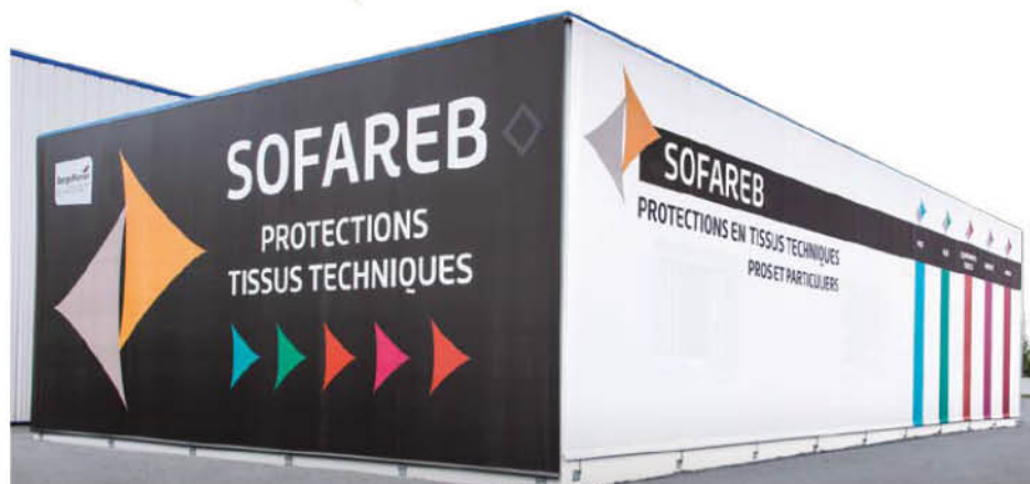
Façade textile (85)